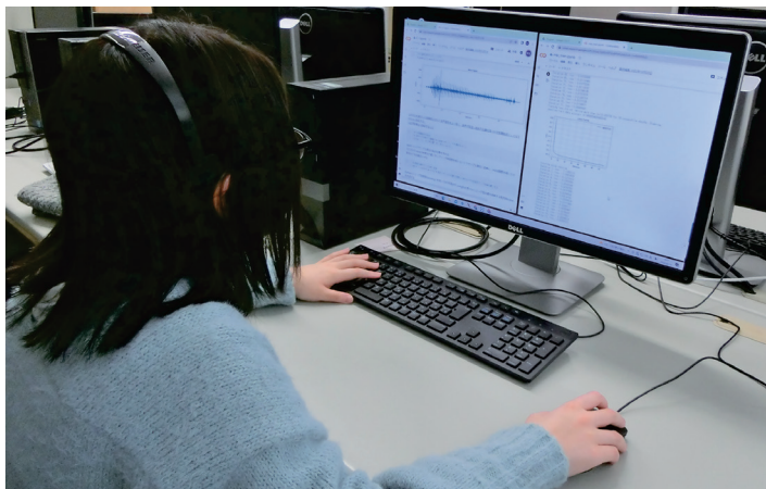
話者認識のプログラム作成中の学生