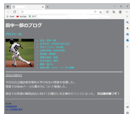
作成した Web ページの例