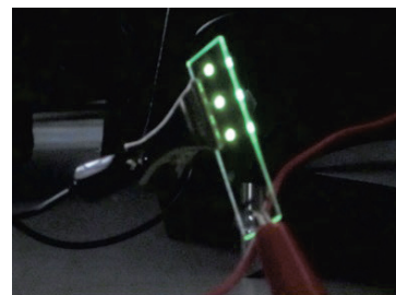
高校生たちと作った有機 EL