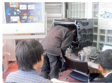
作った有機 EL の測定を行います