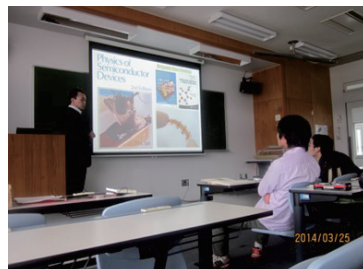
有機 EL の基本を学びます

フレキシブル有機EL (次世代スマホへの応用) フレキシブル有機トランジスタ (指に蒔きつけられる→医療機器への応用) シースルー有機太陽電池 (農地への応用)