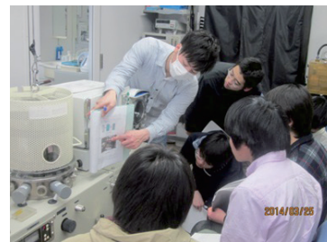
有機 EL の作り方を学びます